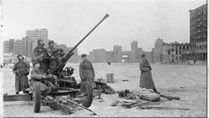
Зенитные орудия на площади Дзержинского.

Эти фотографии, которые датированы февралём - августом 1943 года возвращают нас в то непростое для родного Харькова время.