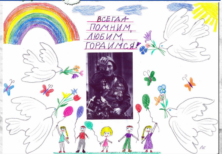
Рисунок Софьи Беленковой, 7 лет

Ми – люди миру, зранені війною, Заповідаєм покликком святили: Шануймо тих, хто не вернувся з бою! Уклін доземний воїнам живим!