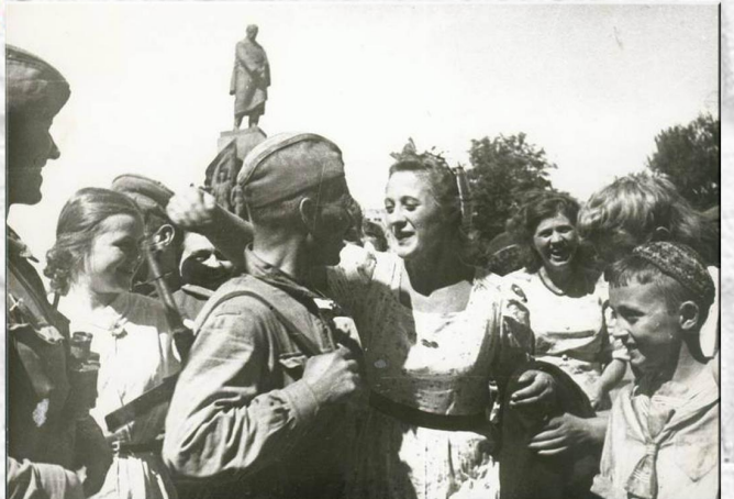
Митинг в честь освобождения Харькова.