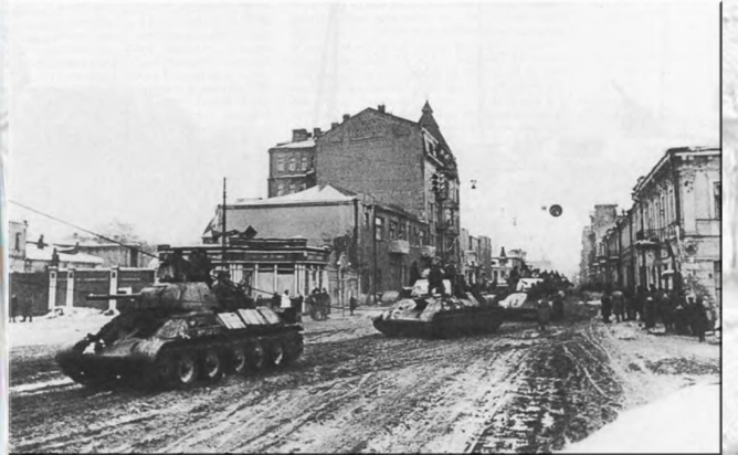
Танки Красной армии в центре Харькова.