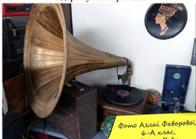
Фото Аглі Фаворової, 6-А клас, Олени Вовк