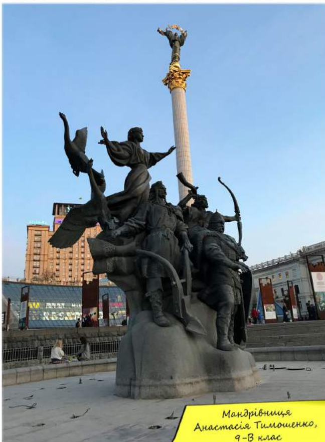
Мандрівниця Анастасія Тимощенко, 9-В клас