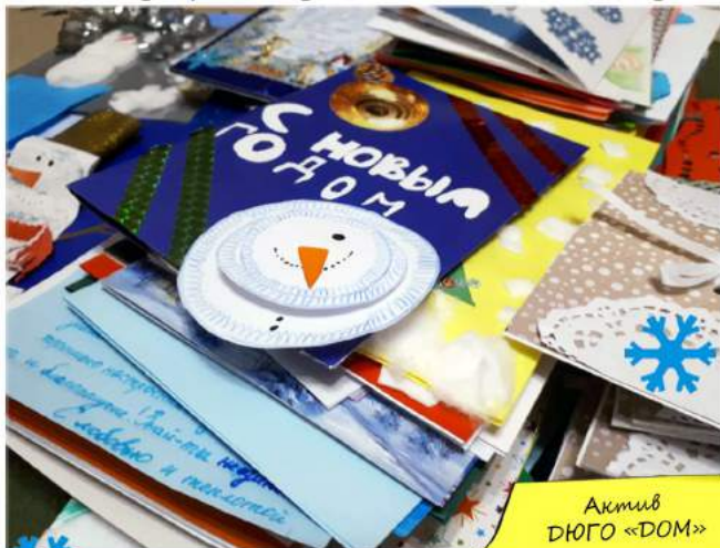
Актив ДЮГО «ДОМ»

Не бійтеся бути чарівниками! Даруйте тим, хто цього потребує хоч трішки свого тепла та доброти!