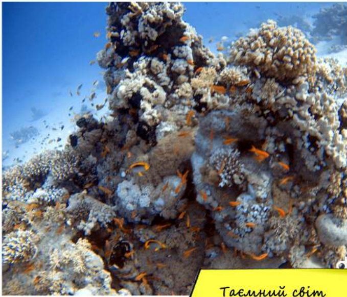
Таємний світ Червоного моря