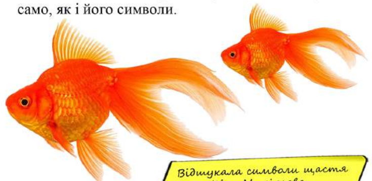
Відшукала символи щастя Кіра Михільова, 9-Б клас

Це те, що саме для тебе уособлює щастя, бо все ж таки воно для всіх різне й у кожного своє, так само, як і його символи.