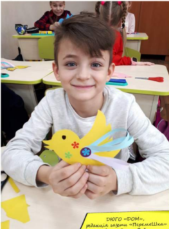
ДЮГО «ДОМ», редакція газети «Перемешка»

Будьте щасливими та розповсюджуйте радість і щастя навколо!