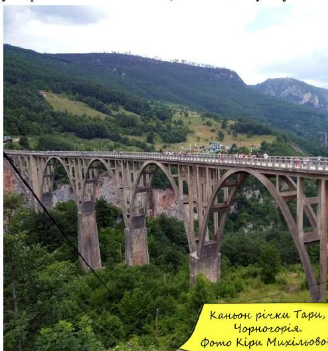
Каньйон річки Тари, Чорногорія.

Тиват – невелике приморське місто, яке обов'язково треба відвідати ввечері. Коли спадають сутінки, просто на вулиці починаються різноманітні концерти, вистави та фаєр-шоу. Крім того, у Тиваті чудові фонтани, які яскраво підсвічуються в темряві. А власне для мене ще одним чудовим спогадом стала нічна прогулянка узбережжям й смаколики, які я тоді скуштувала.