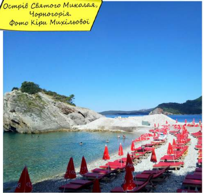
Острів Святого Миколая, Чорногорія.